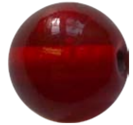
Kärlekspärlorna (2 stycken)

Under mars månad kommer en "liten" utställning om frälsarkransen i Granstugans monter.