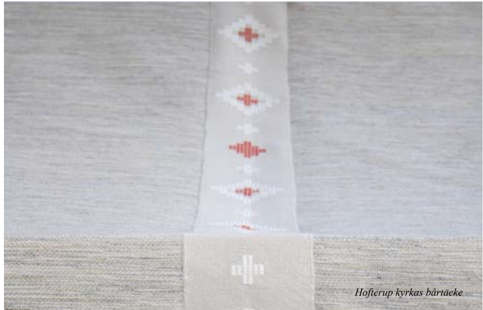
Hofterup kyrkas bårtäcke

Om du är intresserad av att se bårtäcket kommer det att visas på tacksägelsedagen den 14 oktober i Hofterups kyrka i samband med musikgudstjänsten kl. 18.00