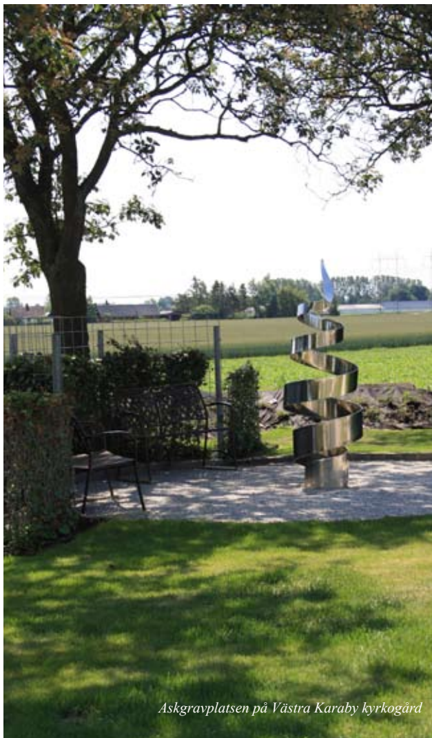
Askgravplatsen på Västra Karaby kyrkogård