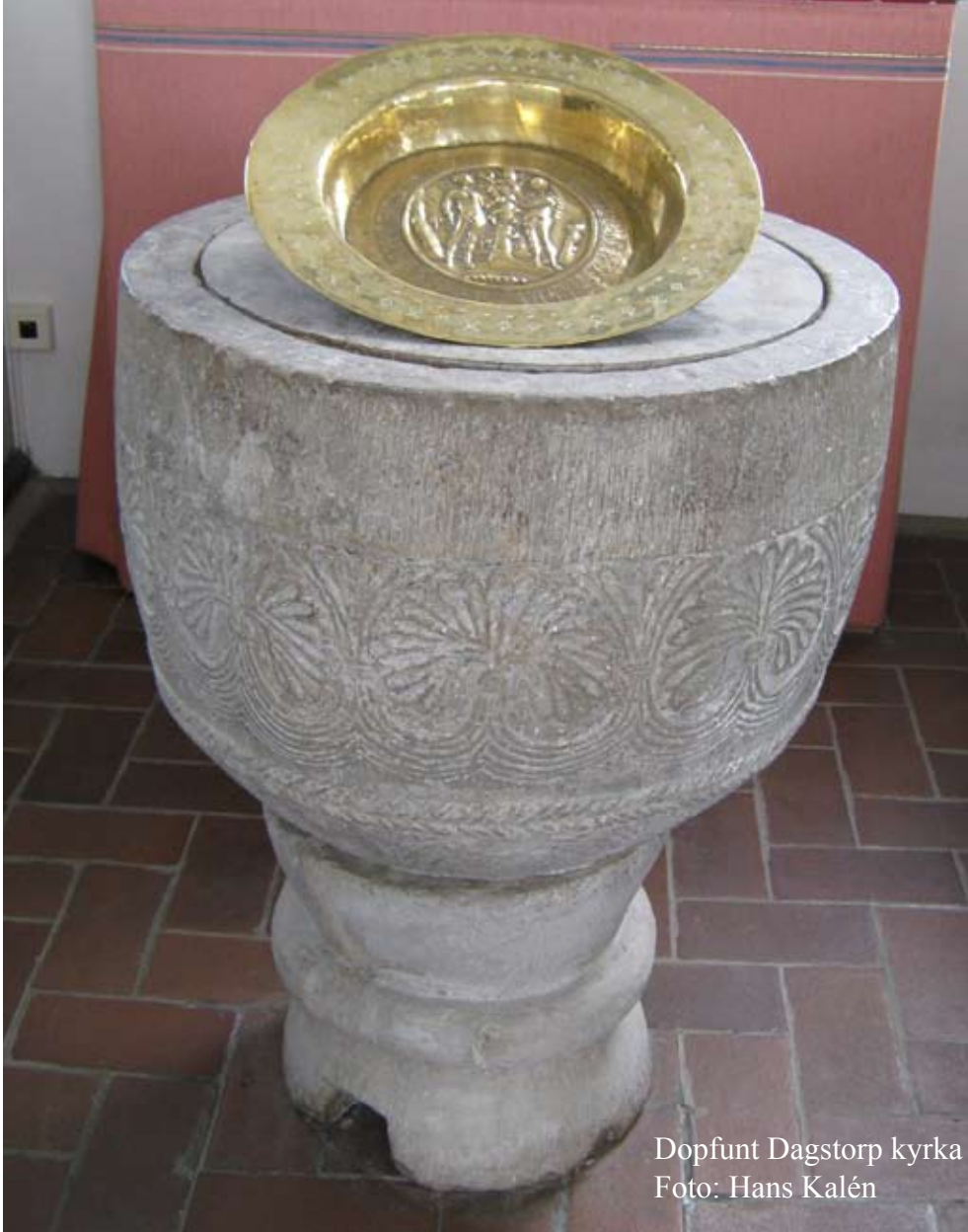
Dopfund Dagstorp kyrka